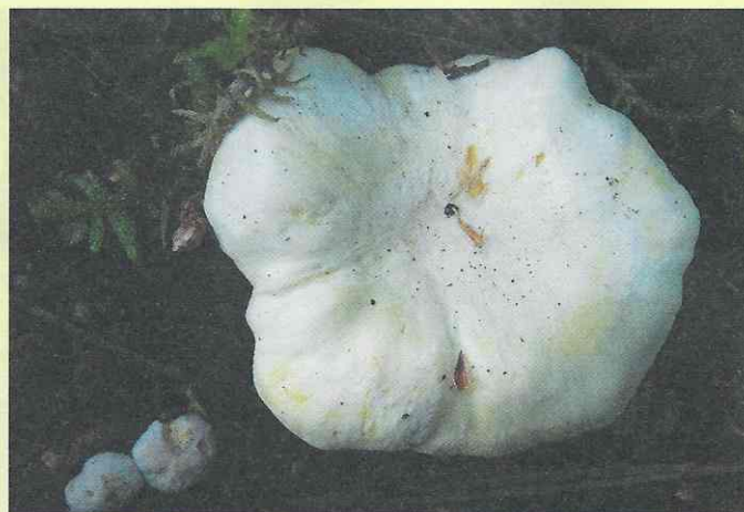
Лисичка белая ( Cantharellus pallens )

Если лисички аметистовые употреблять в пищу