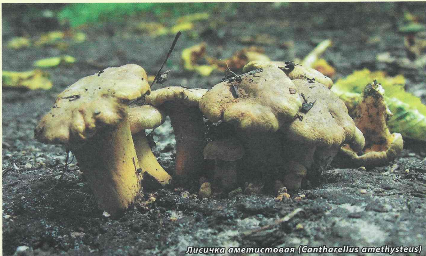
Лисичка аметистовая ( Cantharellus amethysteus )

Лисичка аметистовая ( Cantharellus amethysteus ) начинает плодоносить в начале лета (июнь) а завершение периода плодоношения приходится на октябрь.