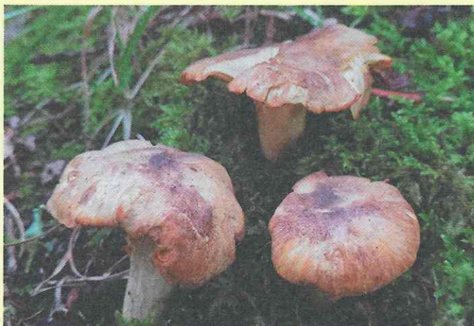
Лисичка аметистовая ( Cantharellus amethysteus )

Гриб распространён в лесистых местностях России, в основном лисичку аметистовую можно увидеть в хвойных, лиственных, травянистых, смешанных лесах. Этот гриб также отдаёт предпочтение не слишком загущенным мшистым участкам леса.