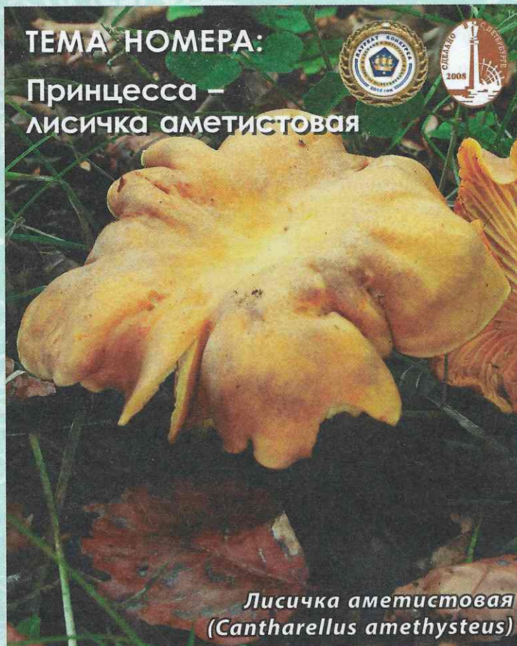
Лисичка аметистовая (Cantharellus amethysteus)