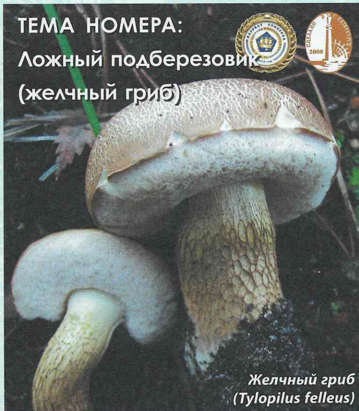
Желчный гриб (Tylopilus felleus)