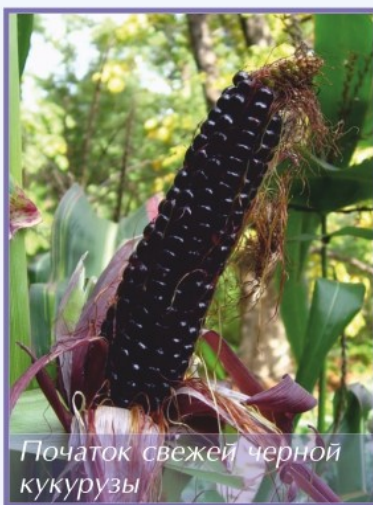
Початок свежей черной кукурузы

Сколько сортов кукурузы вы знаете? Странный вопрос, не правда ли? Конечно, тот, который растет на Украине и в Крыму, украшает пачки с хлопьями и жестяные банки с консервированными зернами. ОДИН сорт. С глянцевыми крупными зернами и роскошной челкой шелковых волокон из-под зеленой одежды початка. ОДИН. И мне, честно говоря, его вполне всегда хватало, и совершенно не интересовало, на какие подвиды он делится и как культивируется, как эти подвиды называются.. Меня вполне устраивала — желтая кукуруза. И мне вполне хватало ОДНОГО сорта. Ну примерно так же, как для рядового перуанца вполне достаточно