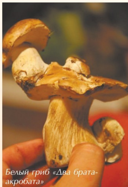
Белый гриб «Два брата-акробата»

Природа гораздо на фантазии. Здесь просто произошло наложение двух зачатков — может механически кто-то придавил грибицу, или дождь размыл гнездышко одного из зачатков и он бросился спа-