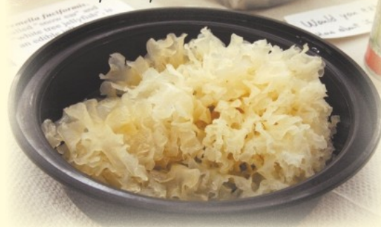
Свежий гриб тремелла

Замечено противовоспалительное действие грибов тремеллы, в Северном Китае на тяжелые гнойные раны и трофические язвы накладывали повязку с свежесобранными грибами — считалось, что они оттягивают температуру и заживляют раны.